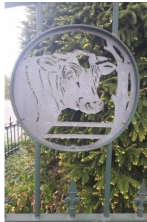
Foto 8 en 9 zitten verwerkt in een hekwerk.